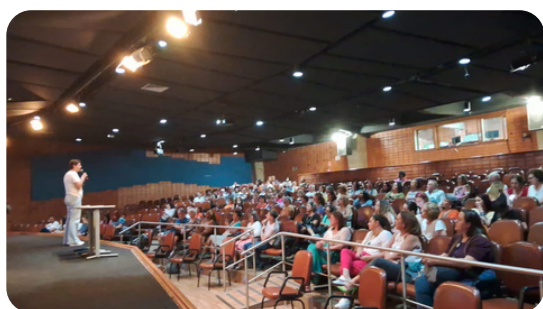
Primeiro evento presencial Escola da Maturidade

Desenvolver ações que contribuam para o envelhecimento saudável e ativo da população idosa de São Paulo mediante a oferta de atividades virtuais transdisciplinares de cunho educativo que contemplem e desenvolvam aspectos físicos, intelectuais, cognitivos e sociais.