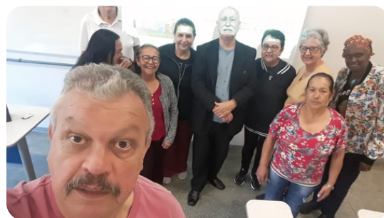
Oficina Cidadania Digital