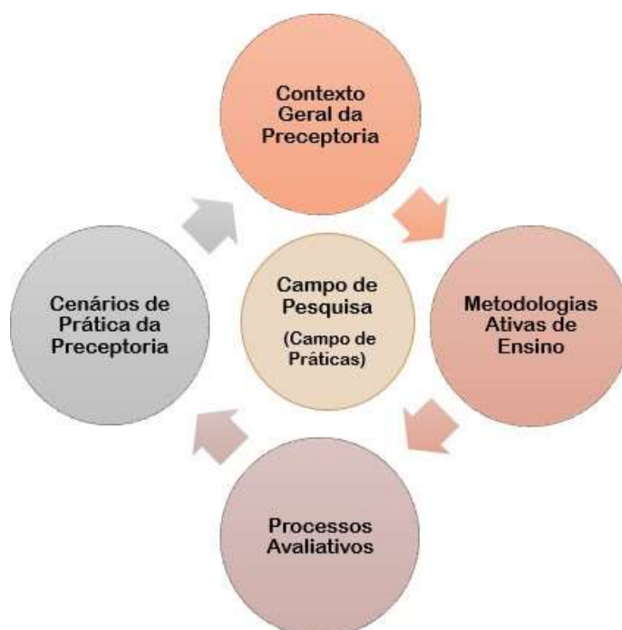
Figura 1: Organização Curricular

O Curso de Pós-Graduação Lato Sensu é estruturado em 4 módulos (semestres) independentes, que podem ser ofertados ou cursados de forma não consecutiva (representados na figura a seguir). Cada módulo possui certificação própria, na lógica de micro certificações ou nanodegrees . Para a concessão do certificado de conclusão do curso de Pós-Graduação Lato Sensu , o participante deve possuir os respectivos certificados de conclusão de cada módulo.